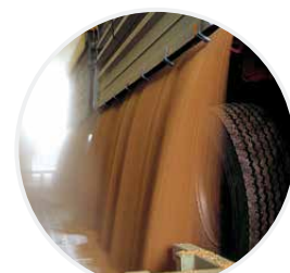
Recepción de Grano